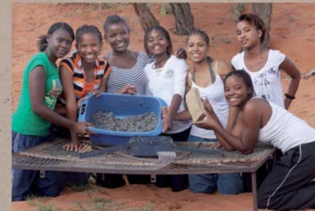
Schüler stellen recycelte Brennbriketts her.