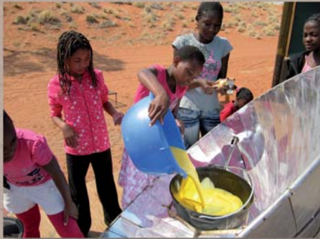
Kursteilnehmer benutzen einen Solarkocher (oben) und überwachen ihren täglichen Wasserverbrauch (unten).