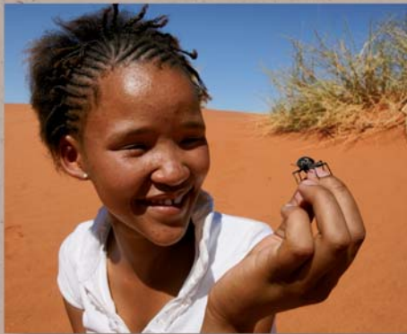
Ein Tok Tokkie Käfer wird untersucht.