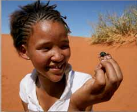
Un enfant observant un scarabée tok tokkie

Ce que les enseignants disent de NaDEET :