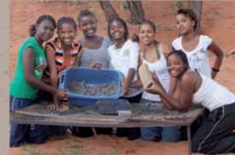
Des élèves fabriquent des briques à brûler